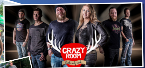
Party mit Live-Musik - CRAZY ROOM